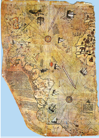
Piri Reis'in Dünya Haritası