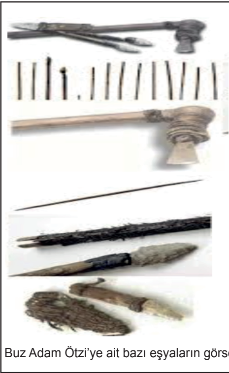
Buz Adam Ötzi'ye ait bazı eşyaların görseli

Günümüzden 20 yıl önce Avusturya-İtalya sınırında Alp Dağlarında yürüyüşe çıkan iki Alman turist, son zirveye de çıktıktan sonra daha kestirme bir yerden dönmek istemişlerdir. Buz halindeki bir dere yatağının erimekte olan kısmında siyah bir leke gözlerine takılmış ve daha dikkatli baktıklarında ise bunun bir ceset olduğunu fark edip polise haber vermişlerdir. Ceset biraz araştırıldıktan sonra önemi hemen anlaşılmıştır. Yapılan araştırmalar sonucunda ceset MÖ 3300'lere tarihlenmiştir. Son yapılan araştırmalara göre öldüğünde 45 yaşlarındaydı, 50 kiloydu ve 165 cm boyundaydı. 1991 yılında bulunduğu anda ise küçülerek mumyalaşmasından dolayı 13 kiloydu. Ölürken üzerinde birkaç farklı hayvan derilerinden yapılmış kıyafetleri ve yine çeşitli otlardan yapılmış pelerini vardı. Ayı kürkünden yapılmış şapkası ise kafasındaydı. Ayaklarında ise yine hayvan derisinden yapılmış, kötü hava koşullarına uygun, su geçirmez ayakkabıları vardı. Ayakkabılarının dış tabanı ayı derisinden iç tabanı ise geyik derisinden yapılmış olup arası ağaç kabuklarıyla doldurulmuştu ve ayakkabının içi kuru otlarla bezenmişti. Yapılan araştırmalar Ötzi'nin genellikle etle beslendiği sonucunu ortaya koydu. Dış minelerindeki zedelenmelerden yola çıkılarak varılan bu sonuç, ölmeden hemen önce dağ keçisi ve geyik eti yediğinin ortaya çıkmasıyla da güçlendi. Cesedin yakınlarında ise Ötzi'ye ait yan taraftaki görselde yer alan eşyalara rastlanmıştır.