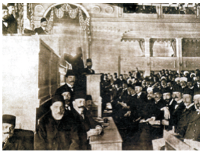
Osmanlı Mebusan Meclisi