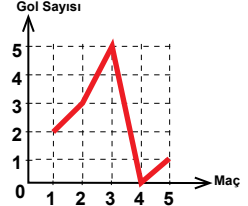
B) Grafik: Maçta Atılan Gol Sayısı