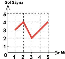
A) Grafik: Maçta Atılan Gol Sayısı